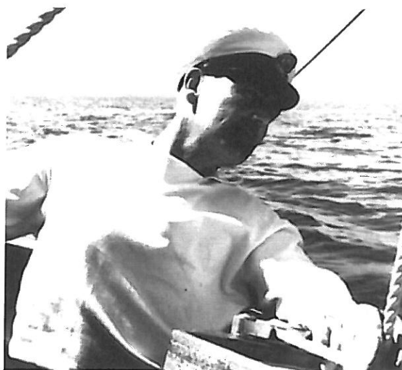
Henri Copponex