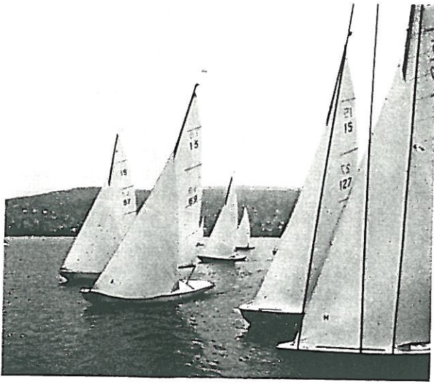
Die 15-m 2 -SNS am Start vor Thalwil